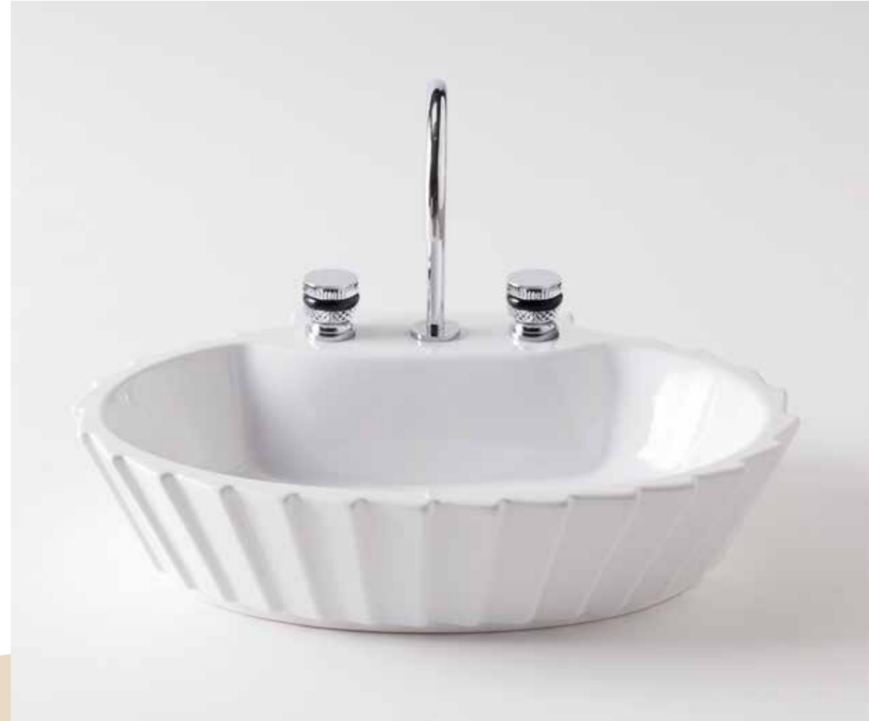
Plissé countertop washbasin in white ceramic with white decorative ring. Charlotte tap in chrome metal finish and black finish.