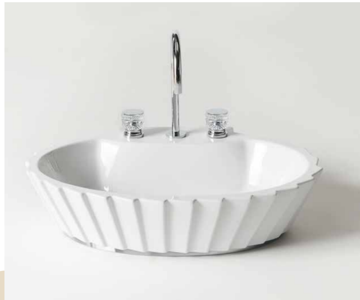
Plissé countertop washbasin in white ceramic with chrome decorative ring. Charlotte tap in chrome metal finish and transparent finish.